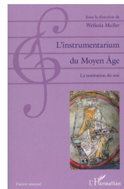
Actes du colloque 2014 Cité de la Musique de Paris - Chartres