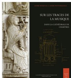
Sur les traces de la musique dans la cathédrale de Chartres